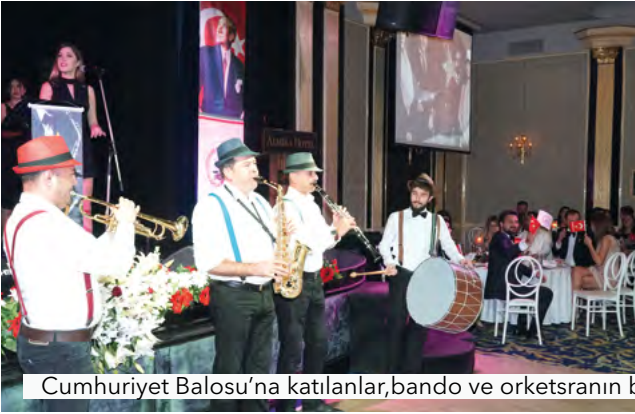
Cumhuriyet Balosu'na katılanlar, bando ve orkestranın birlikte çaldığı 10. Yıl Marşı'na bayrak sallayarak eşlik ettiler.