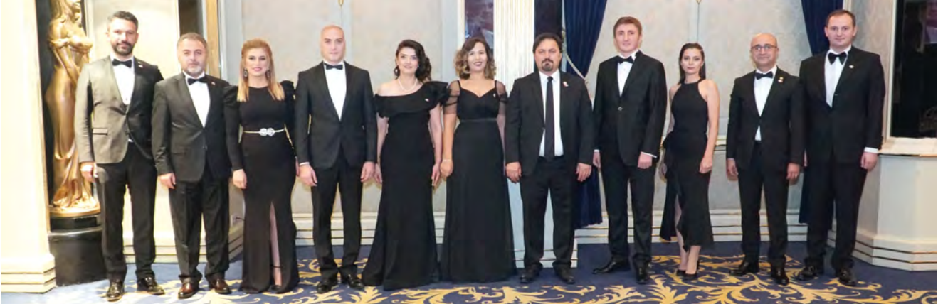
Bursa Barosu Başkan ve Yönetim Kurulu üyeleri, baloya katılan konukları tam kadro toplu halde karşıladı.