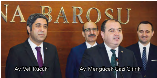
Av. Veli Küçük