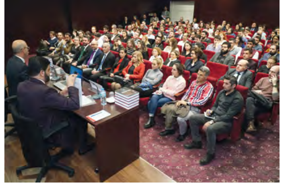
Av. Mengücek Gazi Çıtırık