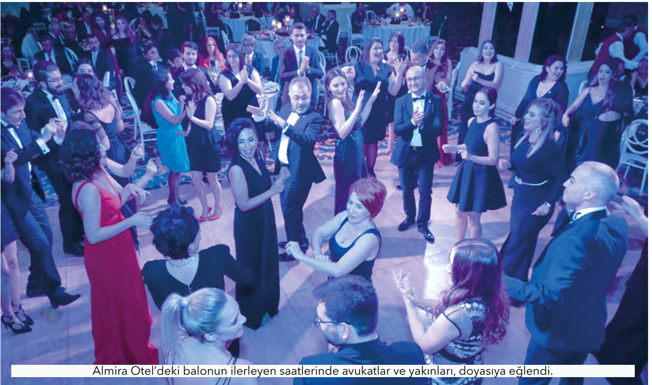
Almira Otel'deki balonun ilerleyen saatlerinde avukatlar ve yakınları, doyasıya eğlendi.